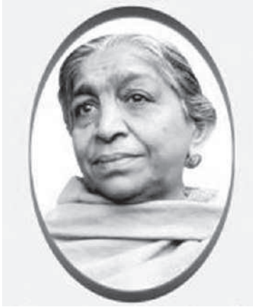
SAROJINI NAIDU ( 1879 1949 )

We and the further generations can never forget her as she has impacted our hearts and mind deeply.