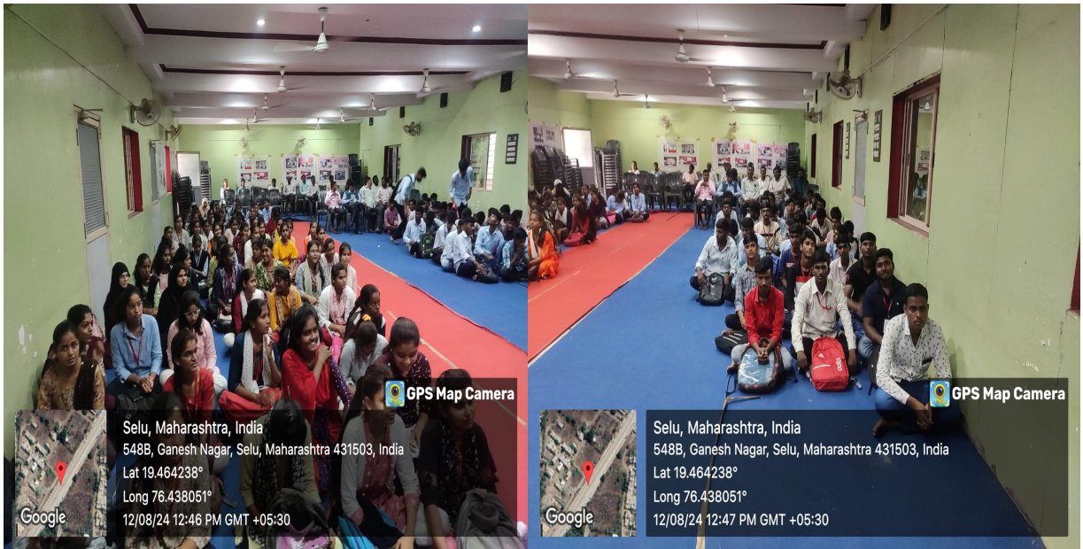
Celebration of Pandit Deendayal Upadhyay Birth Anniversary on 25 th September 2024.