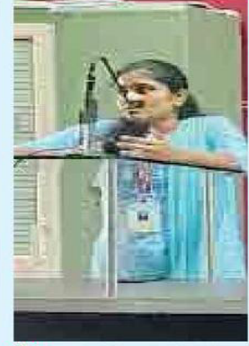
सेलू: नूतन महाविद्यालयात वाचन संकल्प महाराष्ट्राचा उपक्रमांतर्गत पुस्तकावर कथन करताना विद्यार्थिनी.